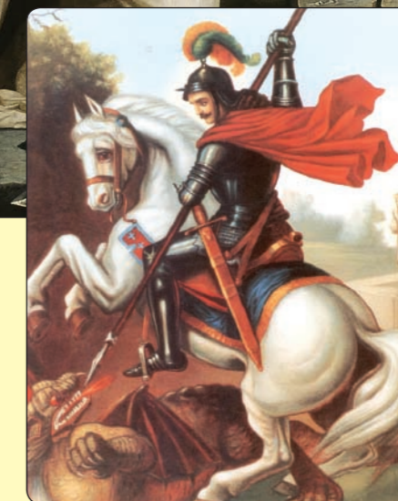
St. George, The martyr